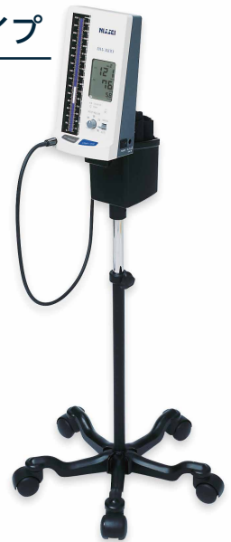
キャリースタンド型 ※キャリースタンドは別売です。